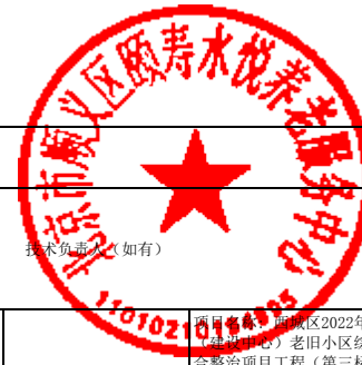
合格申请人商务信息公示表（投标人商务信息公示表）